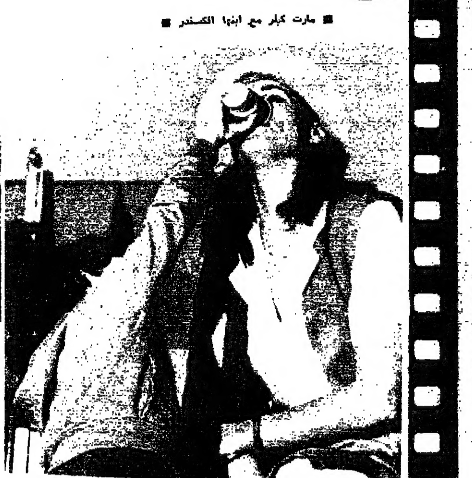
تشرب من بسند